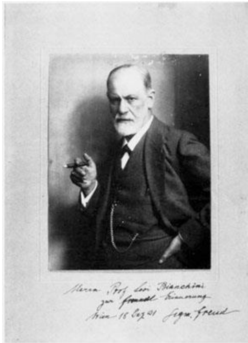
Freud a Marco Levi Bianchini