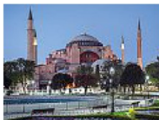
Santa Sofia a Istanbul, Turchia