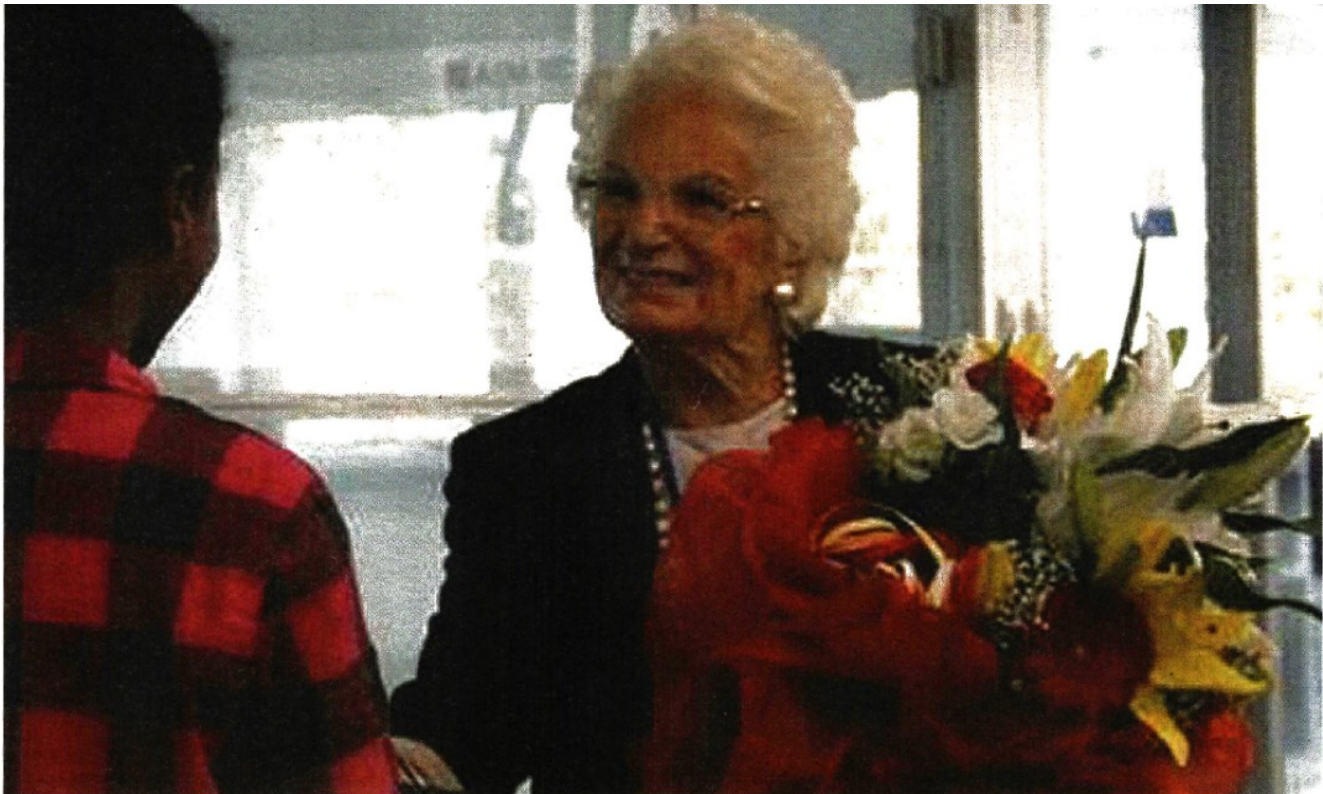
Sorridente La senatrice a vita Liliana Segre, 90 anni il prossimo 10 settembre, riceve un mazzo di fiori da una studentessa in una scuola