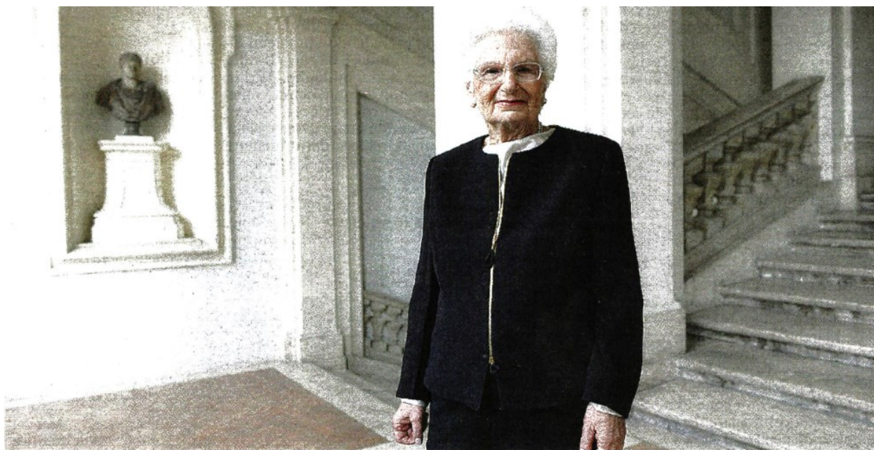
Liliana Segre è stata nominata senatrice a vita nel gennaio del 2018. Superstite dell'Olocausto, è nata a Milano: il 10 settembre compirà 90 anni