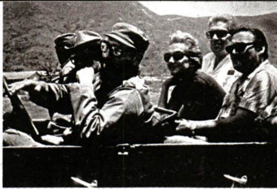
MARCELLO MENCARINI / ROSEBUD2