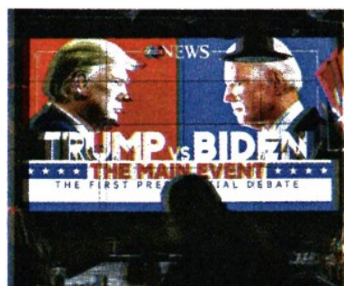
Il primo dibattito tv tra i candidati