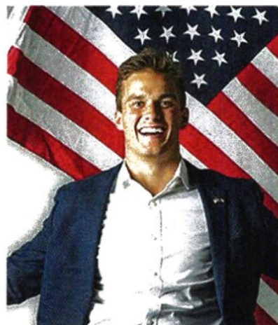
Madison Cawthorn , 25 anni, neo deputato: il più giovane repubblicano di sempre