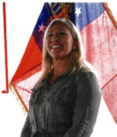
Marjorie Taylor Greene , 46 anni, eletta in Georgia e sostenitrice delle teorie di QAnon