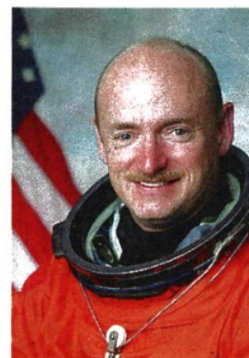
Mark Kelly , 56 anni, ex astronauta, è il nuovo senatore dell' Arizona

ARTICOLO NON CEDIBILE AD ALTRI AD USO ESCLUSIVO DI UCEI - UNIONE DELLE COMUNITA' EBRAICHE ITALIANE