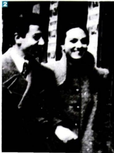
PER GENTILE CONCESSIONE DI VITTORIO DIENA