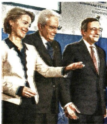
Von der Leyen, Mattarella e Draghi