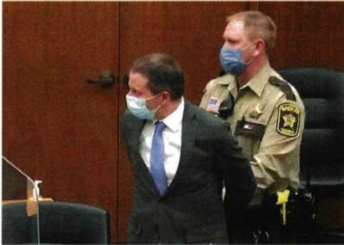
L'agente Derek Chauvin viene portato in carcere dopo il verdetto