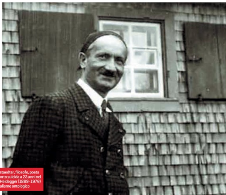
A sinistra Carlo Michelstaedter, filosofo, poeta e scrittore goriziano morto suicida a 23 anni nel 1910. A destra Martin Heidegger (1889-1976) maestro dell'esistenzialismo ontologico