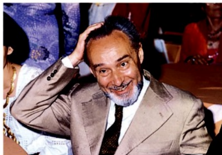
▲ Il chimico Primo Levi