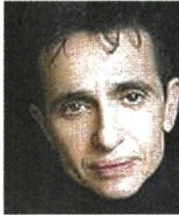
Masha Gessen, 55 anni, intellettuale e attivista. Ha scritto Putin. L'uomo senza volto (Bompiani)