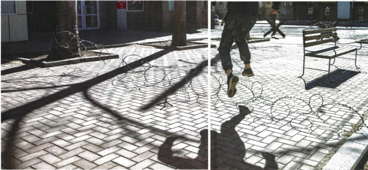
A Mykolah Un ragazzo salta il fido spinato in città (l'immagine)