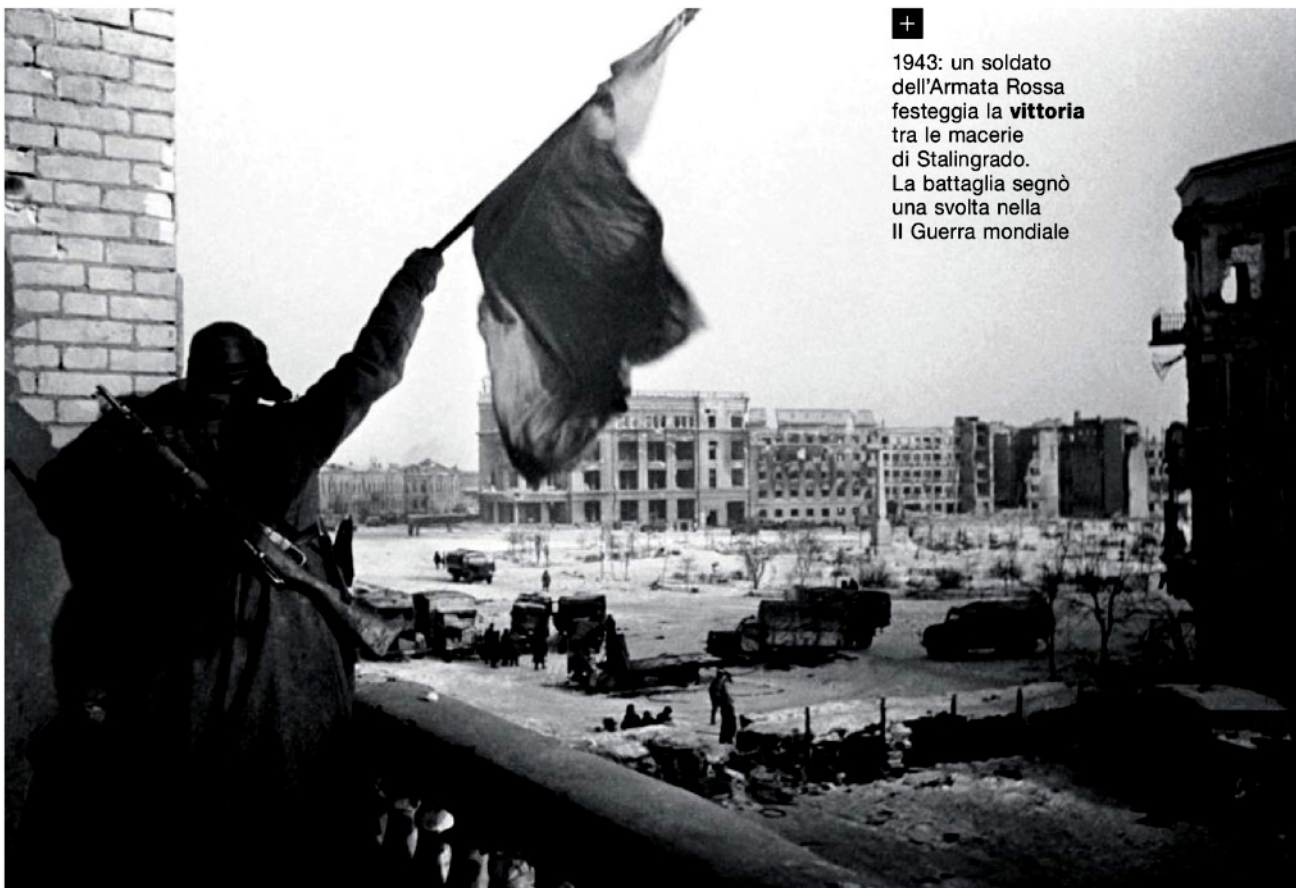
+ 1943: un soldato dell'Armata Rossa festeggia la vittoria tra le macerie di Stalingrado. La battaglia segnò una svolta nella II Guerra mondiale

statua simbolo della vittoria sovietica contro i nazisti, incrociai lo sguardo di Ivan, in partenza verso la Cecenia. Immaginati potesse essere un obiettore di coscienza, pacifista radicale, incapace di uccidere i civili rintanati a Groznyj e quindi pronto ad affrontare la cella di rigore pur di non rinunciare ai propri ideali. Se per avventura, in questi giorni drammatici, mi capitasse di rivedere, nel medesimo luogo, il fantasma di quella giovane recluta, stavolta diretta a Kiev, penserei la stessa cosa. Ma oggi non ho più bisogno di imbarcarmi, come feci allora, sul vecchio Tupolev 134 per tornare nella città martoriata e ricostruita, là dove la Falce e il Martello inchiodarono per sempre la Svastica. Mi basta leggere Stalingrado di Vasilij Semënovič Grossman, pubblicato nel 1952 con il titolo, non voluto dall'autore, Per una giusta causa . Un