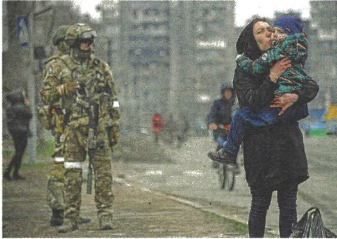
A Mariupol Una donna abbraccia un bambino, la guarda un soldato russo