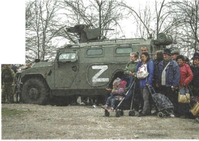
Gli aiuti Milizie russe forniscono aiuti umanitari a Mariupol