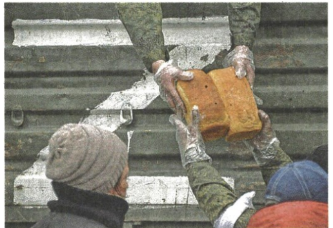
Il cibo Soldati russi e volontari distribuiscono il pane (Afp)