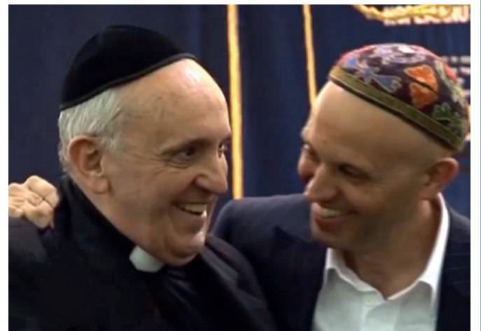
E' la luce condivisa dell'amicizia e del sorriso, quella del cardinale Jorge Mario Bergoglio, oggi papa Francesco, e del leader della sinagoga conservativa di Buenos Aires che lo hanno ospitato all'inizio dell'inverno per festeggiare assieme lo splendore della festa di Hanukkah.