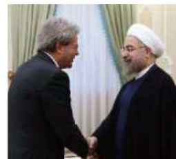
Gentiloni e Rohani

Molto soddisfatta Federica Guidi: «È come se fosse stato tolto un tappo da una pentola che bolliva da molti anni», ha dichiarato il ministro dello Sviluppo economico. (R.E.)