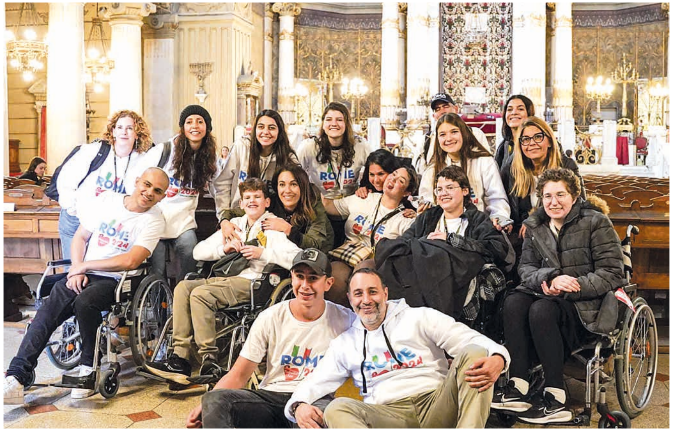
Il gruppo di ragazzi, genitori e volontari di Rachashei Lev, che ha partecipato al viaggio a Roma nel novembre 2024

«Chi ha avuto la possibilità di incontrare questi ragazzi lo scorso anno sa di cosa parlo: è stato toccante vederli entrare nella scuola ebraica, percepire la loro gioia e il loro conforto durante l'incontro con i nostri giovani. Tra di essi qualcuno ha ritrovato la fiducia smarrita e qualcuno si è anche riavvicinato spiritualmente all'ebraismo. Questo perché Rachashei Lev rappresenta al meglio lo spirito ebraico, il sentirsi responsabili l'uno dell'altro». Tre di quei giovani non ci sono più. Carat-