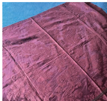
Il parochet realizzato da ebrei sefardite

Di colore viola, il parochet è stato realizzato da un gruppo di ebrei sefardite che 80, 90 anni fa «abitavano a Napoli: erano arrivate bambine o molto giovani da Smir-