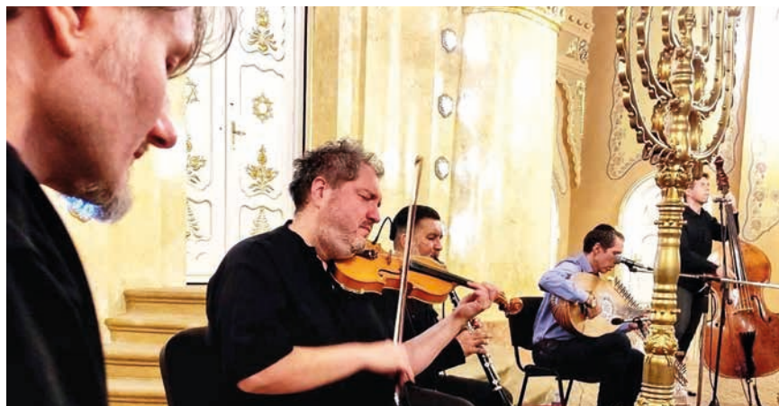
Il festival ideato dal musicista Andrea Gottfried, quest'anno è dedicato a Elias Canetti

È in vista la 29esima edizione del festival Nessiah, uno dei più longevi nel suo genere in Italia, organizzato a Pisa dalla Comunità ebraica. Ideata e diretta dal musicista Andrea Gottfried, che dal 2023 è anche presidente della Comunità, l'iniziativa è in programma dal 30 novembre al 20 dicembre prossimi e avrà come filo conduttore l'esperienza artistica e culturale dei Balcani. E se l'anno scorso Nessiah fu dedicato a Franz Kafka, per omaggiare lo scrittore praghese nel centenario della sua morte, quest'anno il programma ruoterà attorno alla vita del suo illustre collega Elias Canetti, nato nella bulgara Ruse nel 1905 e