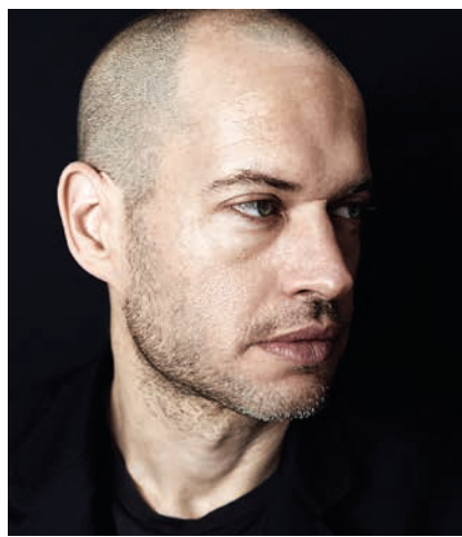
Il regista Nadav Lapid: nel 2019 ha vinto l'Orso d'oro a Berlino con Synonyms

film precedenti, i miei protagonisti erano caratterizzati dal "no"» racconta Lapid, che spiega come sia possibile passare da una fase di opposizione a una di accettazione sottomessa: «Mi sono reso conto, anche