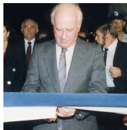
Yitzhak Rabin inaugura la valle delle comunità allo Yad Vashem, Gerusalemme, 1992