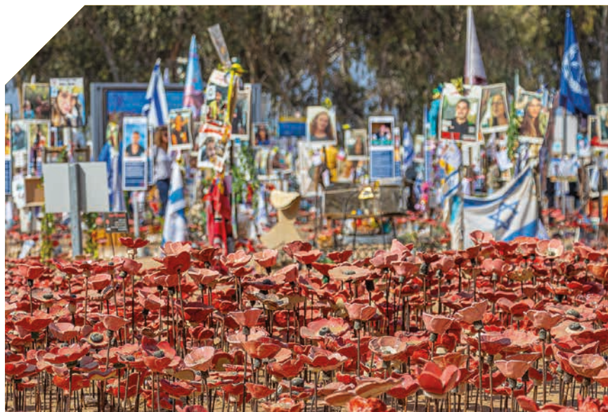
Il sito commemorativo del massacro del Nova Festival, Re'im, Israele

Per questo abbiamo smesso di dialogare con i pro-pal. Non sapevamo quando la pau-